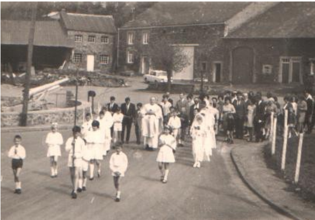
fé ses pâkes

pâkî [o.n.] pâcresse u pâkete [f.n.] valet u bâshele li djoû di s' grande comunion.